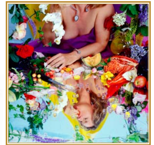
6. Rode paprika