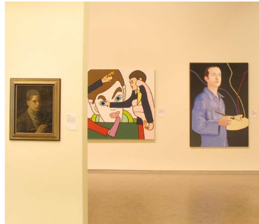
MET EIGEN OGEN, ZELFPORTRETTELEN IN DE NEDERLANDSE MODERNE KUNST VAN 21 MEI T/M 30 AUGUSTUS 2009

Doordat de planning omgegooid moest worden, is in 2009 meer dan voorheen gespeeld met de museale ruimtes. Vaak met verrassende resultaten. Hedendaagse kunst bijvoorbeeld bleek prachtig te staan in een zaal die voorheen gereserveerd was voor archeologie. En ook andere collectieonderdelen kwamen elders in een geheel ander daglicht te staan. Doordat de bezoekers afweken van de gebruikelijke routes, liepen velen met vernieuwd enthousiasme door het museum.